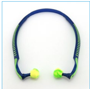
Abb. 4 Bügelstöpsel