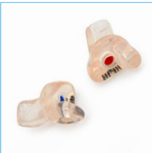
Abb. 5 Gehörschutz-Otoplastik

Ein sicherer Schutz wird nur erreicht, wenn die Gehörschutz-Otoplastik nach der Auslieferung und danach in regelmäßigen Abständen von maximal drei Jahren überprüft wird. Lassen Sie sich das richtige Einsetzen z.B. vom Hersteller oder Lieferanten der Gehörschutz-Otoplastik oder Ihrer Betriebsärztin bzw. Ihrem Betriebsarzt zeigen.