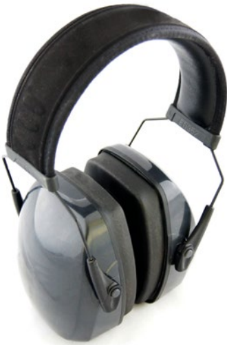
Abb. 1 Kapselgehörschützer