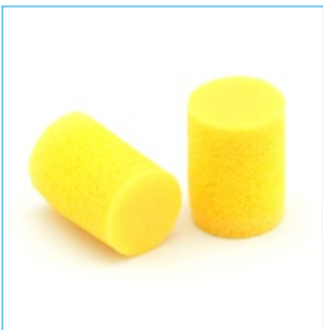
Abb. 3 Gehörschutzstöpsel

Eine Besonderheit sind Bügelstöpsel, welche sich besonders leicht auf- und absetzen lassen und deshalb für häufiges kurzzeitiges Betreten von Lärmbereichen geeignet sind. Ihre Schutzwirkung ist jedoch geringer.